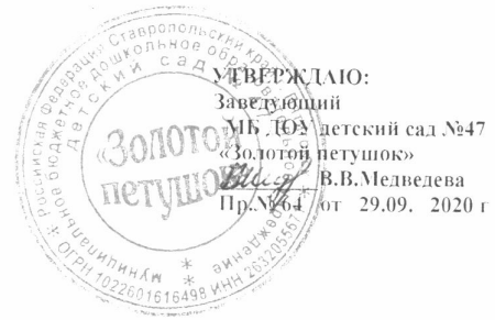
График прохождения курсов повышения квалификации работников МБДОУ детский сад № 47 «Золотой петушок».